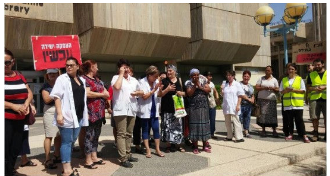
מפגינות למען העסקה ישירה באוניברסיטת בן גוריון

ארגון 'אקדמיה לשוויון' (א"ש) מציין שנה לקיומו ופועל לחשיפת הקשר בין העסקה נצלנית ודיכוי פוליטי בהשכלה הגבוהה