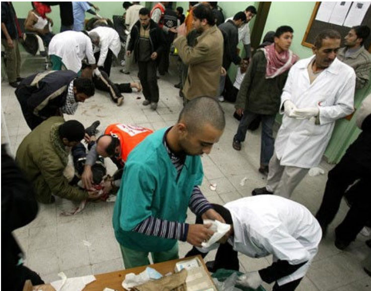
בית החולים שיפא בעת המלחמה בעזה ב-2014. אלפי מטופלים ממתנינים לניתוחים מצילי חיים

בשבוע בו מלאו שנתיים למלחמה בעזה המכונה "צוק איתן", הגיע לביקור בישראל שר החוץ המצרי סאמח שוכרי.