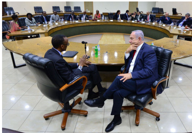
נתניהו ונשיא רואנדה פול קגאמה

מצד אחד, עלינו לדרוש את הפסקתה המידית של התמיכה הצבאית הישראלית בפשעים מחרידים ביבשת אפריקה, מהרודנות הפאשיסטית של מבוטו ססה סקו בזאיר, לפשעי משטר האפרטהייד בדרום אפריקה ועד לפשעי המלחמה הנוכחיים בדרום סודן. מצד שני, עלינו להפנים שאפריקה איננה יבשת נחשלת וחד-גונית, וכמו בשאר העולם - התקווה לשינוי נמצאת דווקא במאבקים שמנהלים תושביה.