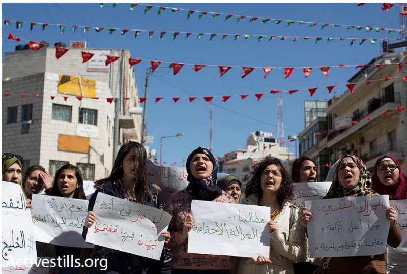
מורות מפגינות ברמאללה, 7.3

המאבק המתמשך של עובדי ההוראה הפלסטינים בגדה מצביע על הדרך למאבק בכיבוש: המוני, דמוקרטי ולוחם