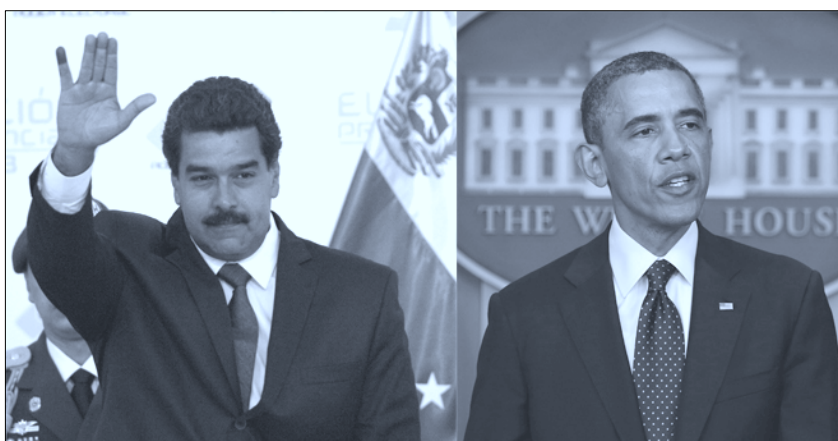
משמאל לימין: נשיא ונצואלה, ניקולאס מאדורו, ונשיא ארה"ב, ברק אובמה

ונצואלה קראה בשבוע שעבר לנספח העסקי מטעמה בארצות הברית לשוב לצורך התייעצות דחופה – כך הודיעה שרת החוץ של ונצואלה, דלסי רודריגז. זאת, לאחר שמוקדם יותר הכריזה וושינגטון על ונצואלה כעל "איום לביטחון הלאומי", והורתה על הטלת סנקציות נגד שבעה בכירים בממשל בוונצואלה. לדברי נשיא ונצואלה, ניקולאס מאדורו, העיצומים שהטילה וושינגטון על בכירים בארצו נועדו להפיל את הממשלה השמאלית בראשותו.