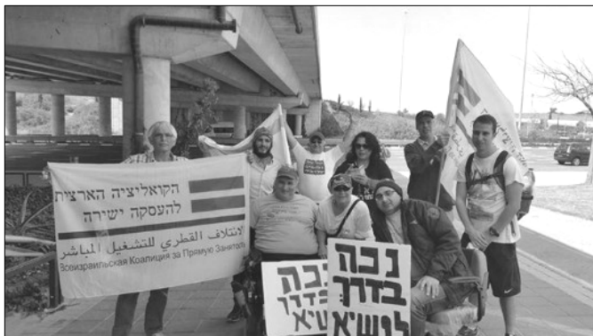
המפגינים בדרכם לירושלים

מחזקים את הלך הרוח בחברה הישראלית בתקופה האחרונה, שאיפשר לפגוע בערבים באשר הם בלי לתת שום דין וחשבון. כולנו עדים לאירועים האלימים הרבים שאירעו בשנים האחרונות כנגד ערבים כמעט בכל מקום. אם מדובר באירועי 'תג מחיר' של קבוצות ימניות נגד פלסטינים בשטחים הכבושים ובתוך ישראל, או בפגיעות אחרות על רקע גזעני נגד אזרחי מדינת ישראל הערבים".