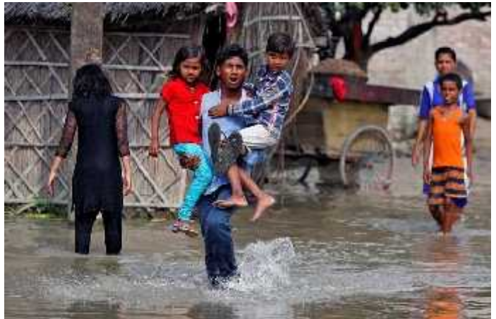
השיטפונות בהודו

חלק עצום מעושריו של המערב מתבסס על העוני באפריקה ובאסיה. עושר זה החרוב ועוד מחריב את שאר חלקי כדור הארץ. הקשר בין התחממות כדור הארץ לממדי השיטפונות אינו עומד לדיון. המשבר הסביבתי מתעצם עם הקפיטליזם הגלובלי; השיטפונות האדירים הם עדות לכך. הודעת ארצות הברית, התורמת הראשית לאסון הגדול הצפוי לכדור הארץ, על פרישתה הקרבה מהסכם פריז נמצאת רק ברקע הדיווחים. הנשיא טראמפ יכול להכריז על יום תפילות למען הניצולים ואפילו לתת תרומה "נדיבה" בסך מיליון דולר, מתוך המיליארדים שטקסס תזדקק להם. השוק הפרטי יחגוג שוב את הישגיו, על חשבון הניסיון לרסן את פגעי האקלים, על חשבונן של אסיה ואפריקה.