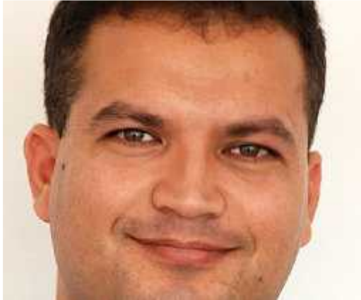
להשתמש בה כחלופה לחומר הקיים.

הספר הרשמי טרם תורגם לערבית. התלמידים נבחנו בבגרות לפי החומר שנלמד בעברית. לפיכך, התארגנו המורים לאזרחות בחברה הערבית והקימו את פורום המורים הערבים לאזרחות. אחת היוזמות, שגובשה בשיתוף פעולה עם ועדת המעקב, היא הכנת חוברת לימוד שאפשר